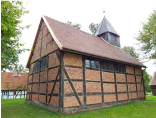
Die neue Dacheindeckung in Wootz

05.10.2021 von Ev. Kirchenkreis Prignitz