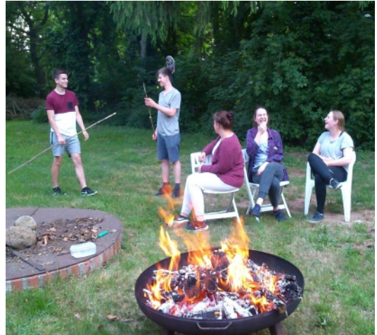
Lagerfeuer mit Stockbrot in Lindenberg

Ab und zu übernachten wir im großen Pfarrhaus oder machen eine Filmnacht mit Popcorn.