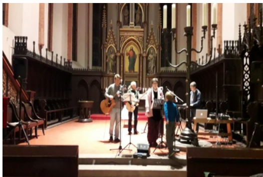
Jugendgottesdienst in Perleberg