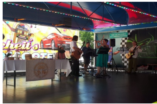
Autoscootergottesdienst in Kyritz