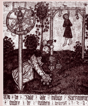
Angeblich: Der Jude vergräbt die Hostien unterm Galgen