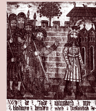
Angeblich: Der Jude flüchtet nach Pritzwalk