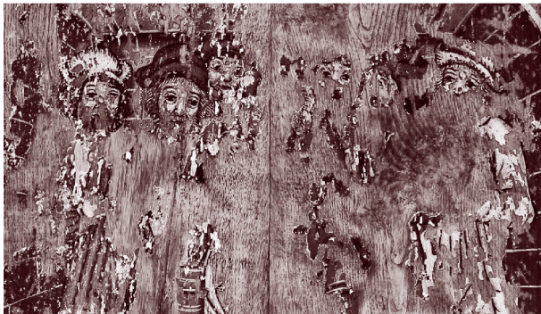
Angeblich: Der Jude wird durch einen falschen Priester überlistet (Ausschnitt)

Kloster Stift zum Heiligengrabe Stiftgelände 1 16909 Heiligengrabe Telefon (033962) 808-0