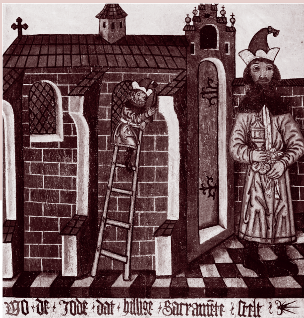
Angeblich: Der Jude stiehlt ein Tabernakel mit den geweihten Hostien aus der Pfarrkirche in Tschow