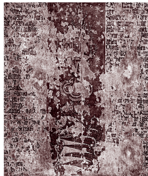
Heiligblutverehrung und Wunderglaube im Spätmittelalter

Markgraf Otto V. gründete das Kloster Heiligengrabe als Zisterzienserinnenkloster am Ende des 13. Jahrhunderts. Mehr als 200 Jahre später wurde seine Gründung mit einer judenfeindlichen Legende verbunden. Diese behauptet, ein Jude habe im Jahre 1287 eine geweihte Hostie aus der Kirche im späteren Heiligengrabe gestohlen. Aufgehalten durch »göttliche Gewalt« habe er die Hostie auf einem Richtplatz vergraben, wobei sie angefangen habe zu bluten. Seine blutigen Hände würden ihn auf der Flucht verraten haben und er sei vor einen Richter geführt und zum Tode verurteilt worden. Der Richtplatz, an dem die Hostie angeblich vergraben wurde, sei zu einem wundertätigen Ort geworden, was den Markgrafen zur Gründung des Klosters veranlasst habe.