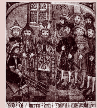
Angeblich: Tschower Bauern stellen den Juden in Pritzwalk und wollen ihn zum Geständnis zwingen