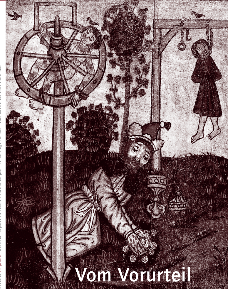
TITELBILD Angeblich: Der Jude vergräbt die Hostien unterm Galgen GESTALTUNG: Christine Bokelmann