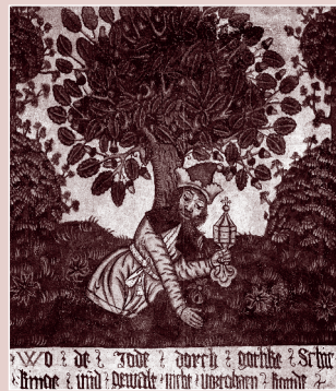
Angeblich: Der Jude wird durch göttliche Fügung und Gewalt am Fortgehen gehindert