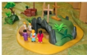
Auf den Spuren Jesu Die Ostergeschichte in Bildern

Spielt ihr gern mit Playmobil oder anderen Figuren? Schaut Euch diese Geschichte an, und wenn Ihr Lust habt, dann spielt sie nach! Ostern ist ein Fest der Freude und bringt Hoffnung in die Welt. Ihr könnt Euch das Heft auch ausdrucken und ein Buch daraus basteln.