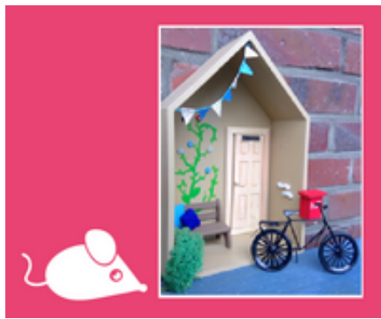
Teil 3 - Micha und das vergessene Fest