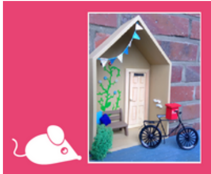
Teil 4 - Micha und das Osterlicht