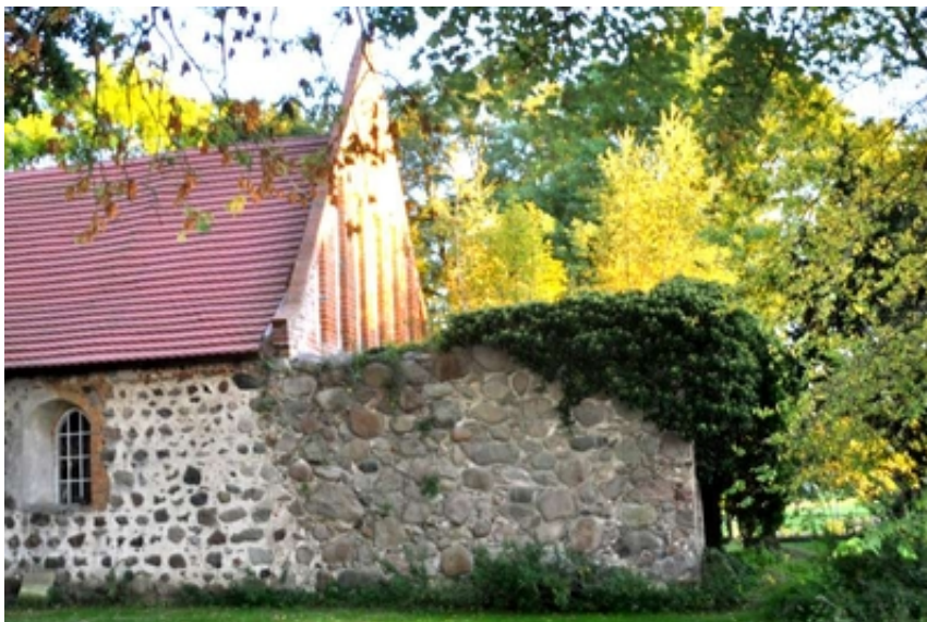
Turmstumpf Kirche Rosenhagen