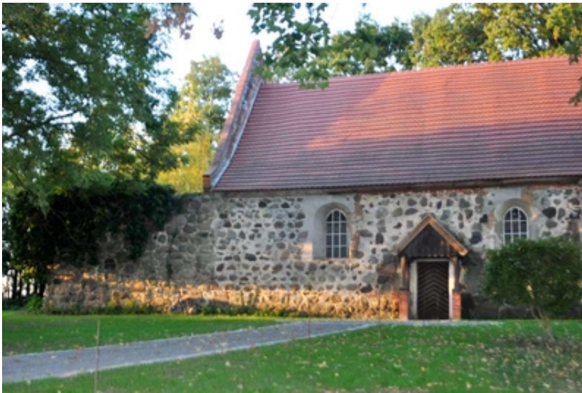
Kirche Rosenhagen von Süden